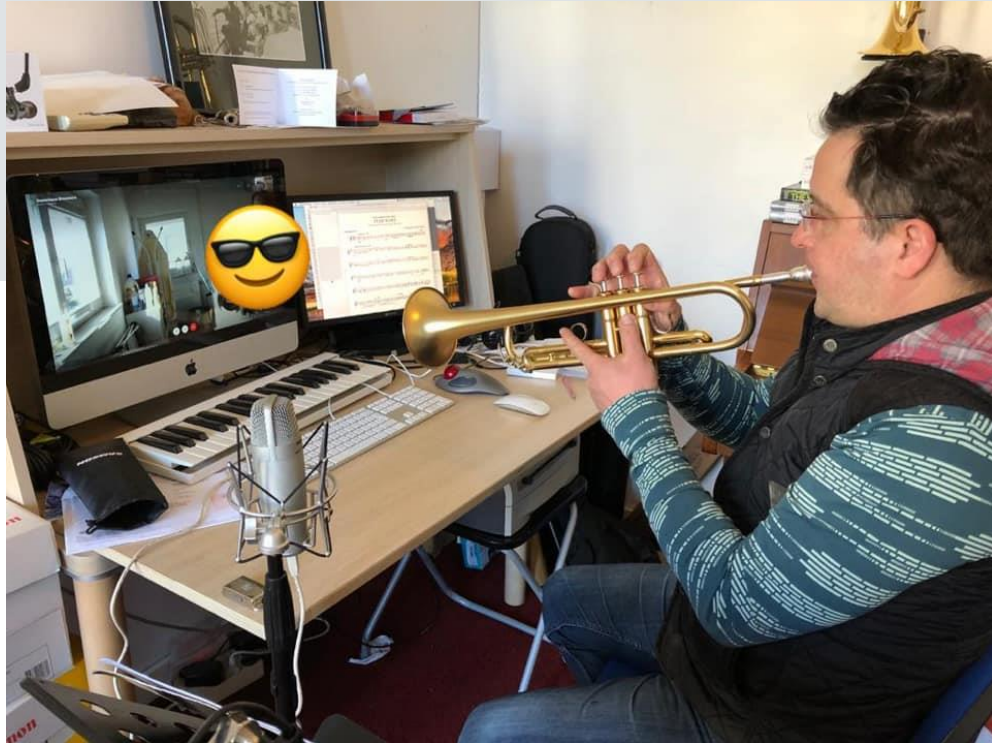
Docenten geven nog nu online les, het bestuur vergadert online en zelf leden zijn inmiddels begonnen met het filmen van hoe ze oefenen.